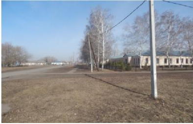
Фото на странице: 0